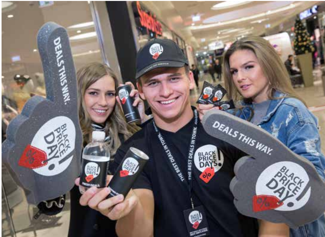
Deals und Prozente: Der Black Price Day am 23. November verspricht im Schlosspark-Center jede Menge Einkaufsspaß.

Danach geht es Schlag auf Schlag: Am Montag, dem 26. November, startet das Center in die Vorweihnachtszeit – mit Lichterglanz, Plätzchenduft und vielen Aktionen bis zum Fest. Erstmals funkelt in diesem Jahr der neue Weihnachtsschmuck im Schein tausender Kerzen. An der Treffpunkt Bühne öffnet die Backstube, in der Kinder leckere Kuchensterne herstellen können. An den Wochentagen sind Ofen und Küchentisch Kindergruppen vorbehalten, eine Anmeldung ist unter der Telefonnummer 0385-5932010 möglich. Ohne Anmel-