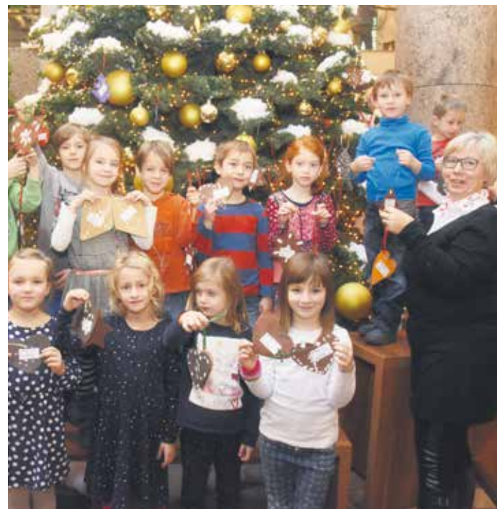
Rückblick 2016: Kinder aus der Kita „Villa Traumland“ schmückten den Wunschbaum im Center.

per, dem Spargelhof Schuart und der Erzgebirgischen Draxelstüb. Auch die Dreescher Werkstätten und der Unicef-Grußkartenstand werden auf dem kleinen Markt erneut mit von der Partie sein. Seite 4,5,7