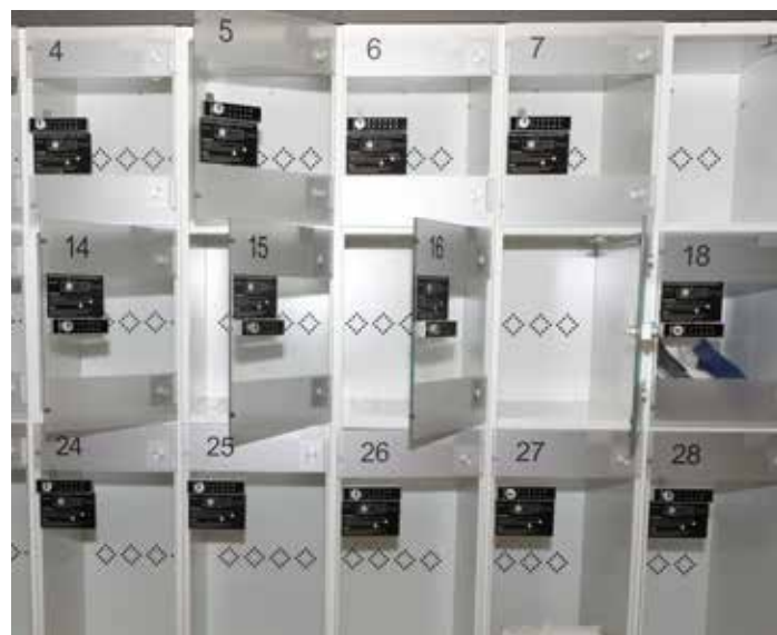
Alles für die Sicherheit: Das Schließfach-System im Schlosspark-Center ist neu organisiert.

ganisiert worden: Gegenstände können für maximal 24 Stunden eingeschlossen werden. Das ist wichtig, damit Fächer nicht monatelang belegt werden. Durchsichtige Türen erlauben einen Blick ins Innere – aus Sicherheitsgründen. Eine Haftung für eingeschlossene Gegenstände wird nicht übernommen.