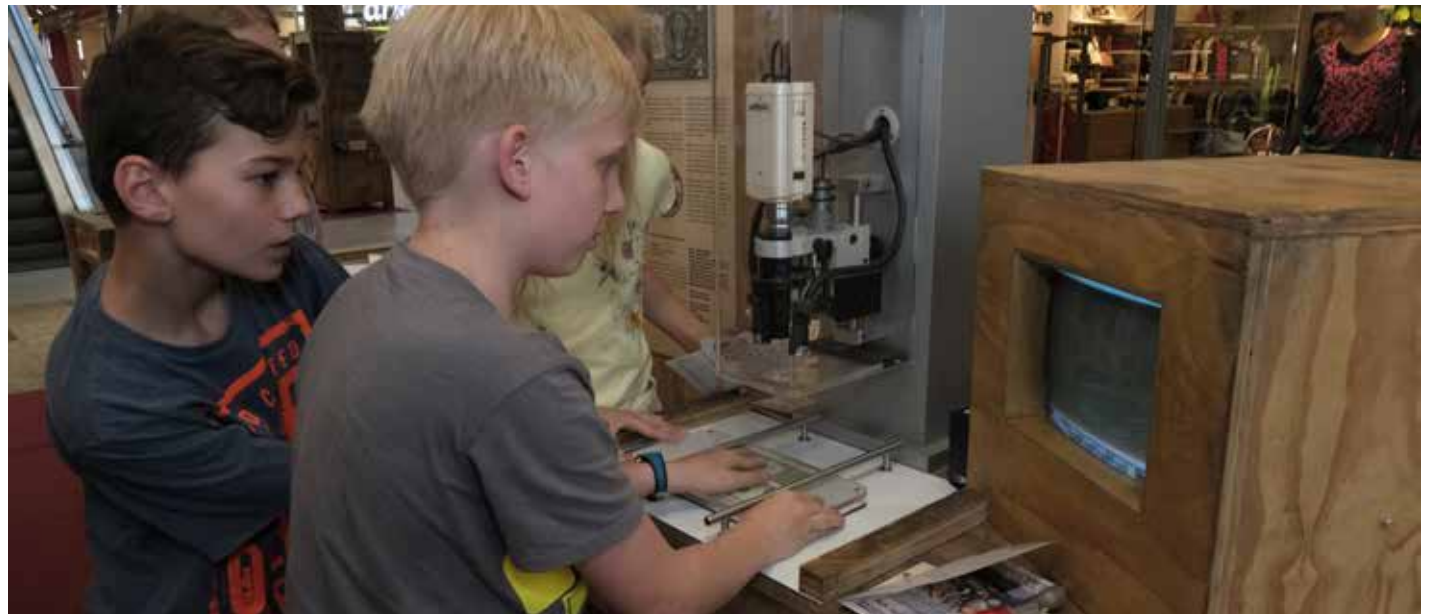
Das Entschlüsseln geheimer Schriften gehört zu den Herausforderungen für Agenten.

noch schicke Ranzenmodelle und Rucksäcke für die Größeren auf ihren Einsatz im neuen Schuljahr.