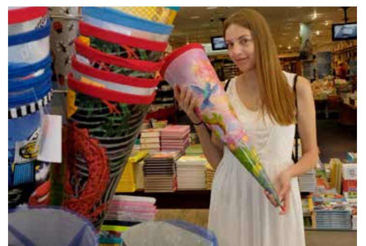
Große Tüte, kleine Tüte? Für alle Wünsche gibt es im Center die richtige Größe.

Und was sagt nun der Zuckertütentrend 2019? Neben Bestsellern wie Rennwagen und Pferden ist erlaubt, was gefällt.